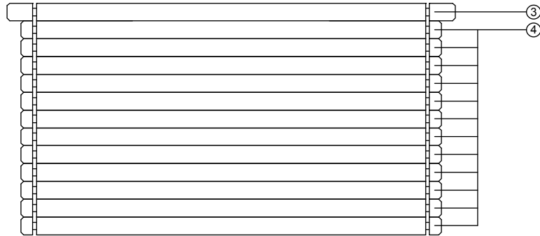
ACHTERWAND - RÜCKWAND - BACK WALL